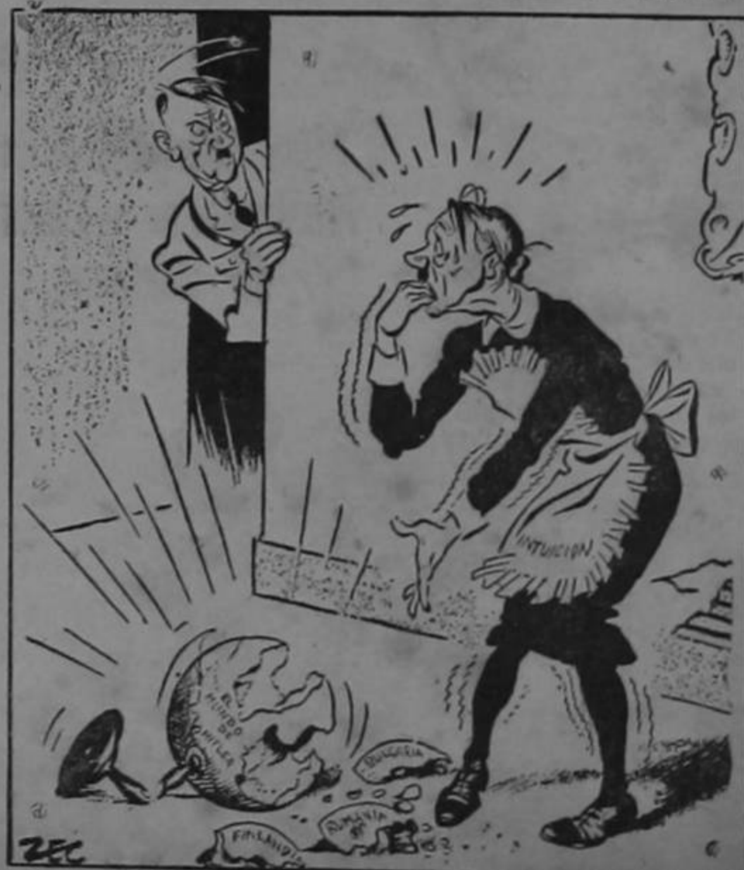
"SE ME CAYO DE LAS MANOS!"

Desde las SEIS de la mañana hasta las DOCE de la noche