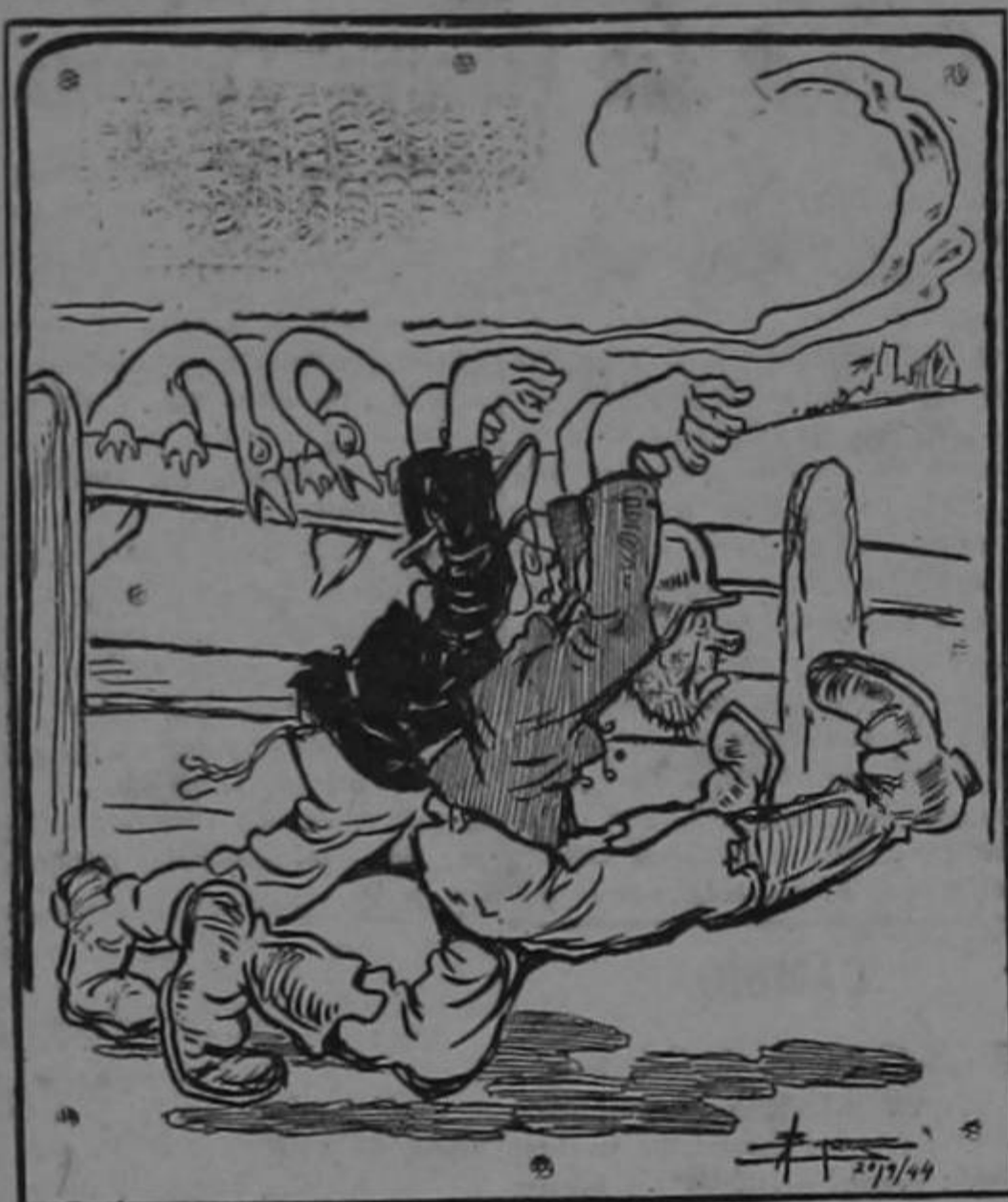
EL PASO DEL GANSO, ESTILO 1945

OTRA VEZ SOBRE LAS VOCES (Viene de la pág. DOS).