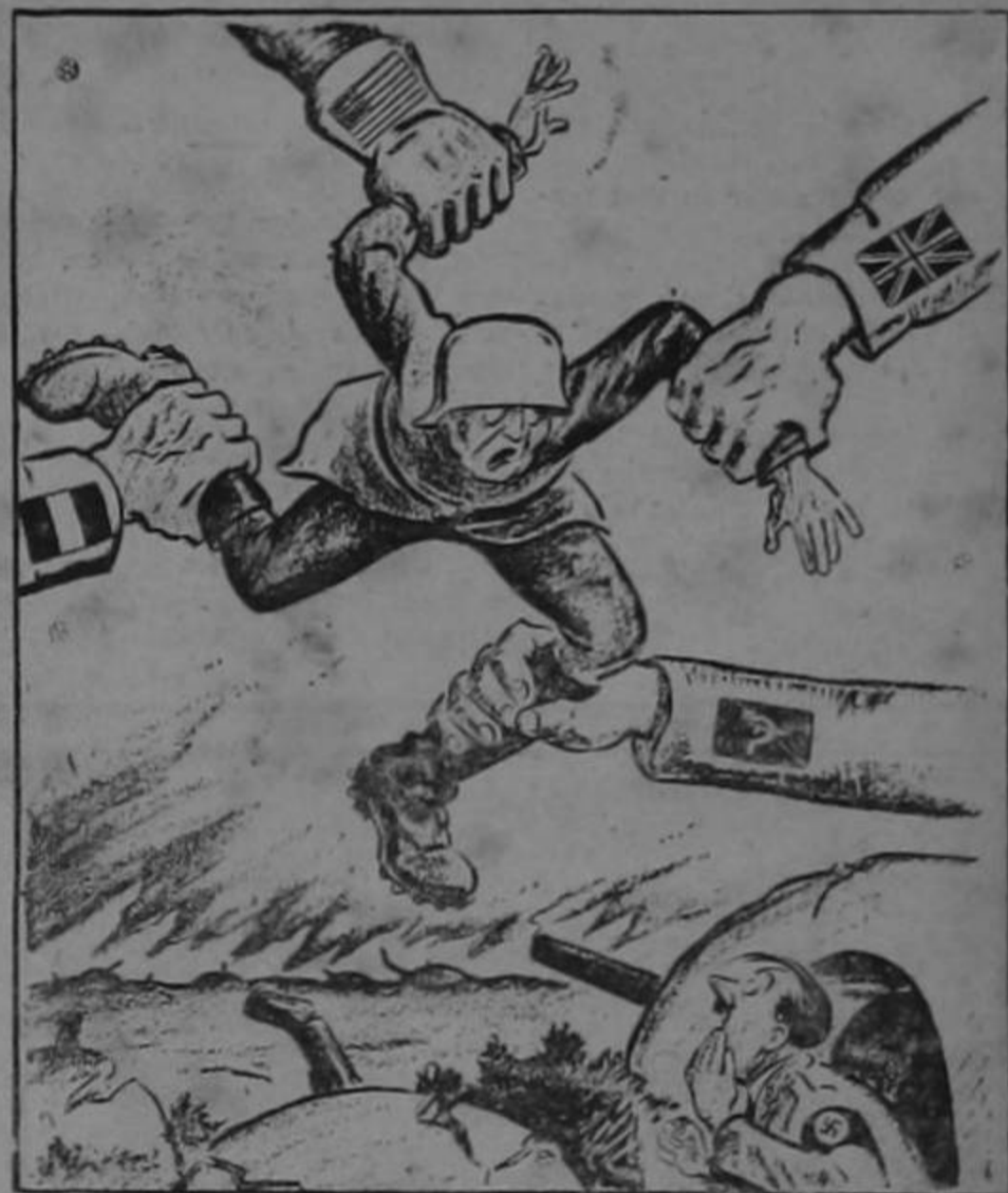
LA SVASTIKA SOBRE ALEMANIA

—De la ortografía. Me como todas las haches.