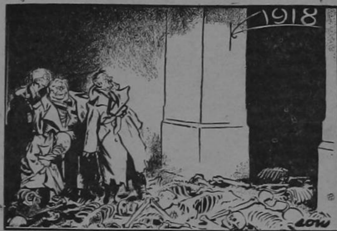
EL CAMINO DE RETROCESO

—Hombre lo felicito repuso el señor—; por más remedios que tomo yo no consigo que se me abra el apetito.